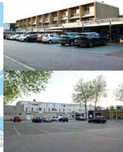
Het horecablok >> 05